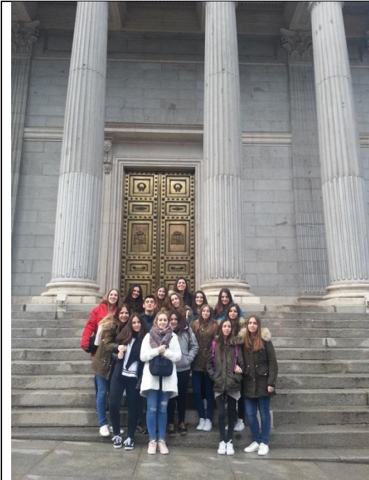
Puerta del Congreso de los Diputados