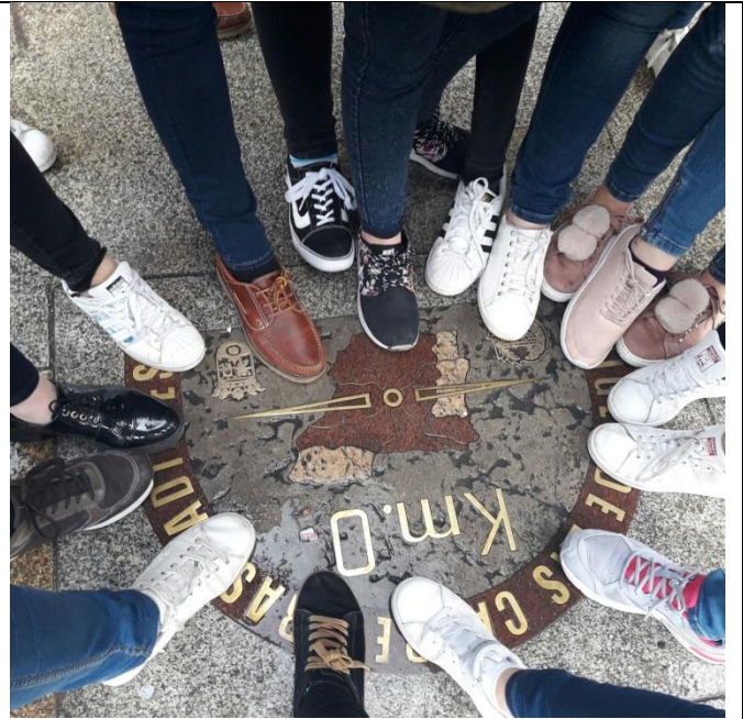
Km 0 en la Puerta del Sol