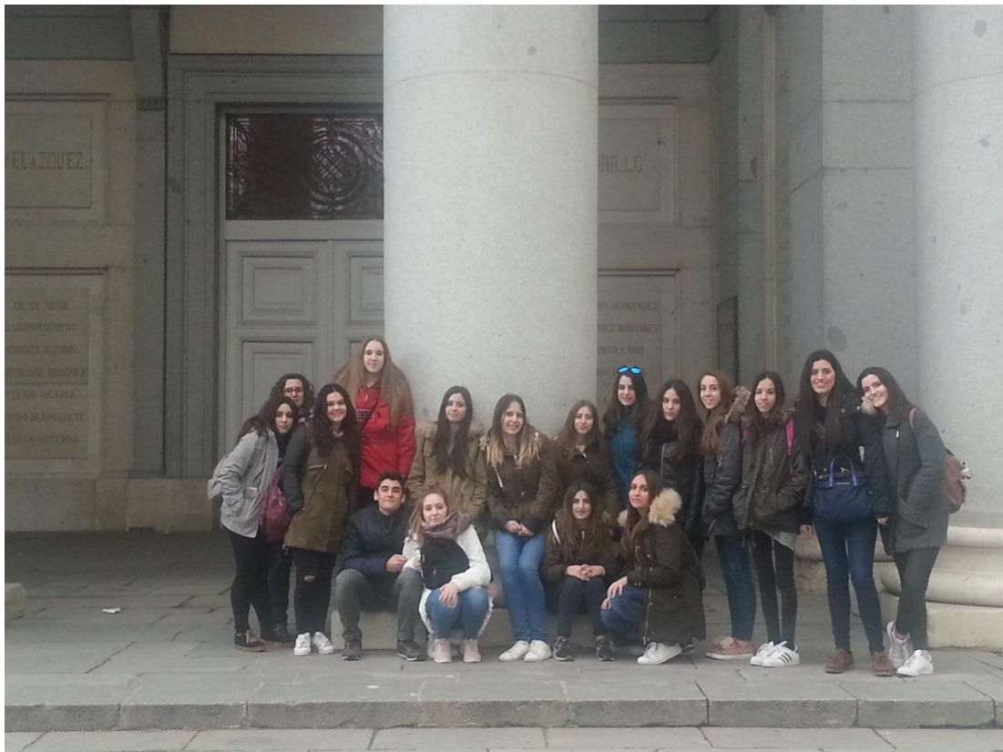
Puerta principal del Museo Nacional del Prado